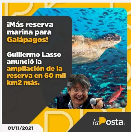
01 de noviembre de 2021

A continuación, se presenta una de las piezas gráficas que publicó cada medio de comunicación para cubrir conflicto suscitado en Galápagos, en la primera se muestra como el recurso gráfico divertido y tipo meme es utilizado por La Posta, este medio se identifica por construir y difundir las noticias con un lenguaje cercano, divertido y coloquial, por su parte GK mantiene una línea más estructurada, formal pero atractiva a la vez, el recurso infográfico permite