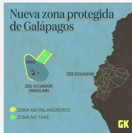
04 de noviembre de 2021

La publicación que genera más comentarios y reacciones entre las dos ejemplificadas anteriormente es la de La Posta, con 2.500 reacciones y más de 400 comentarios, por su parte la publicación de GK genera 30 reacciones y 2 comentarios. El lenguaje y la gráfica atractiva y divertida muestran mayor cercanía y por ende más recepción por parte de los usuarios, la imagen del presidente Guillermo Lasso. Esto muestra las nuevas