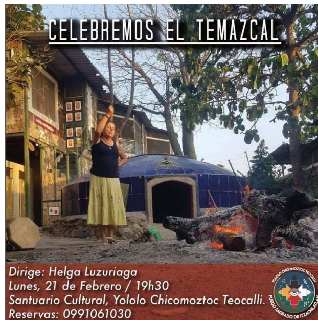
Fig. 4. Aviso publicitario de Temazcal. Santuario Cultural Yololo

Este ritual se practica todos los lunes dentro del santuario a las ocho de la noche y tiene una duración aproximada de una a dos horas.