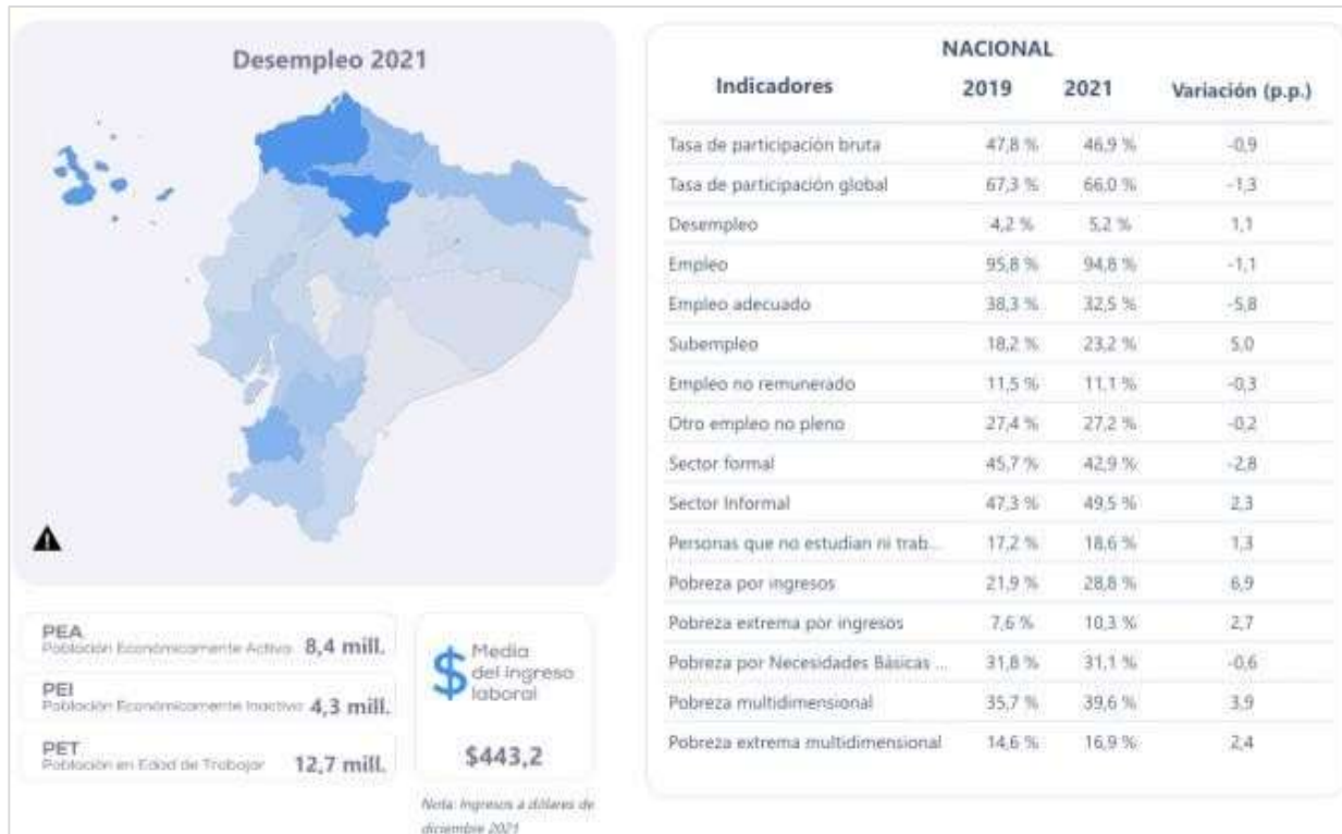
Tabla 2. El desempleo en Ecuador